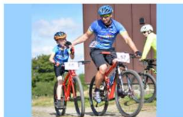
HOBBY NA ČERCHOV - kategorie pro doprovod nejmenších závodníků za 50,- Kč

Datum | Středa | 2.8.2023 - 9:31:58 STUPNO - ZISK TITULU MISTR PKSC