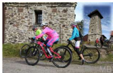
POZVÁNKA NA ČERCHOV - 9. ZÁVOD SERIÁLU AC HEATING CUP