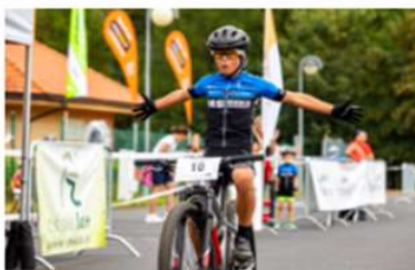
AŠ: STĚNA SMRTI JAKO NEJOBLÍBĚNĚJŠÍ ATRAKCE