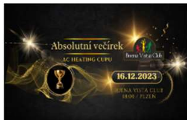
ABSOLUTNÍ VEČÍREK AC HEATING CUP 2023 aneb SLAVNOSTNÍ VYHLÁŠENÍ VÝSLEDKŮ