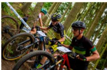
SKVĚLÉ STUPNO: NAVZDORY NEPŘÍZNÍ POČASÍ + výsledky Elite muži UCI C2 + štafety