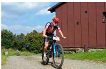
ČERCHOV: výstup na nejvyšší horu Českého lesa zvládlo 119 bikerů a 11 běžců